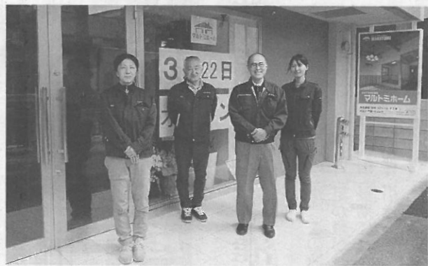
マルチホームの従業員

富建設を前身とする。HSGは「幸福を生む住まい」を提唱し、最盛期には全国150社ほどの木材販売店や工務店が加盟する組織と